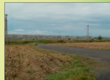
Obec Dobratice: Obnova MK Dobratice - 1C Nádraží–Hranice , červenec 2010 Celkové výdaje projektu: 2 436 075,- Kč; výše proplacené dotace: 1 474 815,- Kč