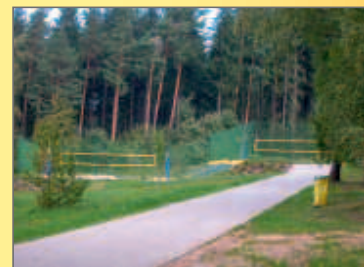
Obec Baška: Obnova a údržba veřejných prostranství v obci Baška, oprava centrálního chodníku k autokempu , červenec 2010 Celkové výdaje projektu: 1 051 196,- Kč; výše proplacené dotace: 748 739,- Kč