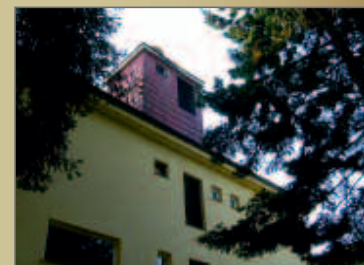
Město Brušperk: Rekonstrukce hasičské zbrojnice ve městě Brušperku , srpen 2010 Celkové výdaje projektu: 1 272 744,- Kč; výše proplacené dotace: 814 533,- Kč